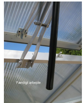
7: Færdigt arbejde