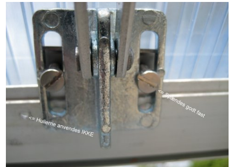
3: De forborede huller anvendes IKKE Beslaget spændes godt fast