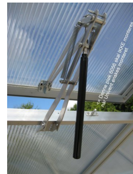
6: Pløk 6056 monteres IKKE.