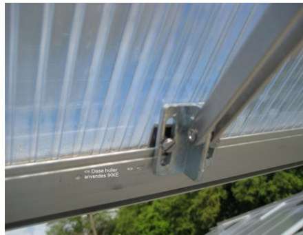
2: Anvend de SMÅ to forborede huller