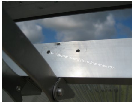
5: De forborede huller anvendes IKKE